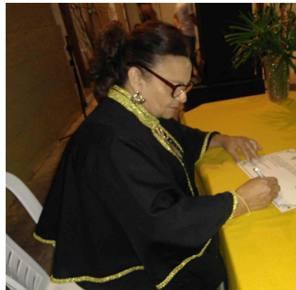
(Benemérita da Sociedade dos Poetas de Barbalha)

Conquistou espaço na Sociedade dos Poetas de Barbalha, e o respeito de todo colegiado, por mérito próprio, e hoje, além de madrinha da cordelteca é Sócia Benemérita da referida entidade, foi empossada em Abril de 2019.