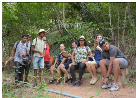
(III trilha da poesia com prosa e versos nas paradas)