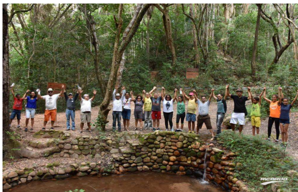
(II Trilha da poesia – Geossítio Riacho do Meio, mística de saudação a natureza, abril de 2018)